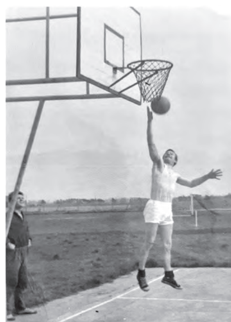
Le « Chris » dans sa spécialité.