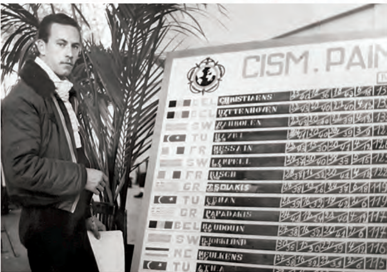
Een record dat vandaag wellicht nog stand houdt...