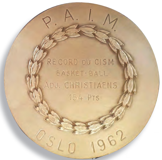
Un record sans doute inégalé à ce jour...

De tweede anekdote is minder aangenaam aangezien het gaat om het overlijden van een Franse mededinger tijdens de oriëntatiewedstrijd te Athene in 1964. Hij werd meerdere dagen als vermist opgegeven. Toen wij Athene verlieten was hij nog steeds niet teruggevonden. Blijkbaar is hij in een ravijn gevallen. Dit om maar te zeggen hoe uitzonderlijk veeleisend de omstandigheden waren... de hitte, het reliëf...".