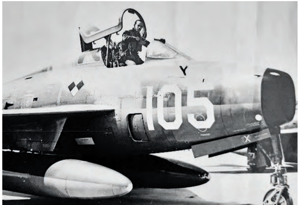
België wint de vluchtcompetitie.