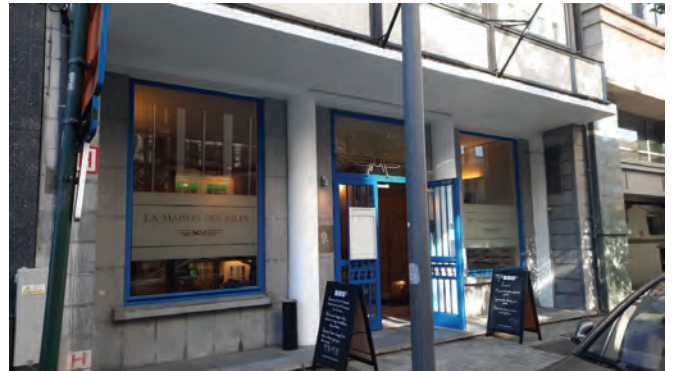
L'entrée sans l'auvent De ingang zonder het bordes