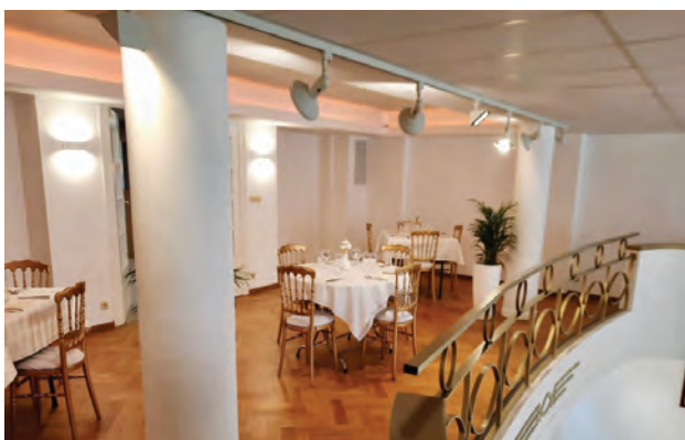
Le coin VIP sur le balcon. - De VIP-hoek op het balkon