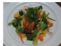
Bon appétit! - Smakelijk!