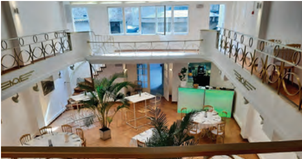
Vue du bar temporaire à partir du balcon Zich van de tijdelijke bar vanaf het balkon