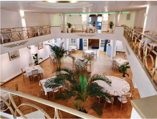
L'entrée de la salle Leboutte à partir du balcon De ingang van de Leboutte-zaal vanaf het balkon