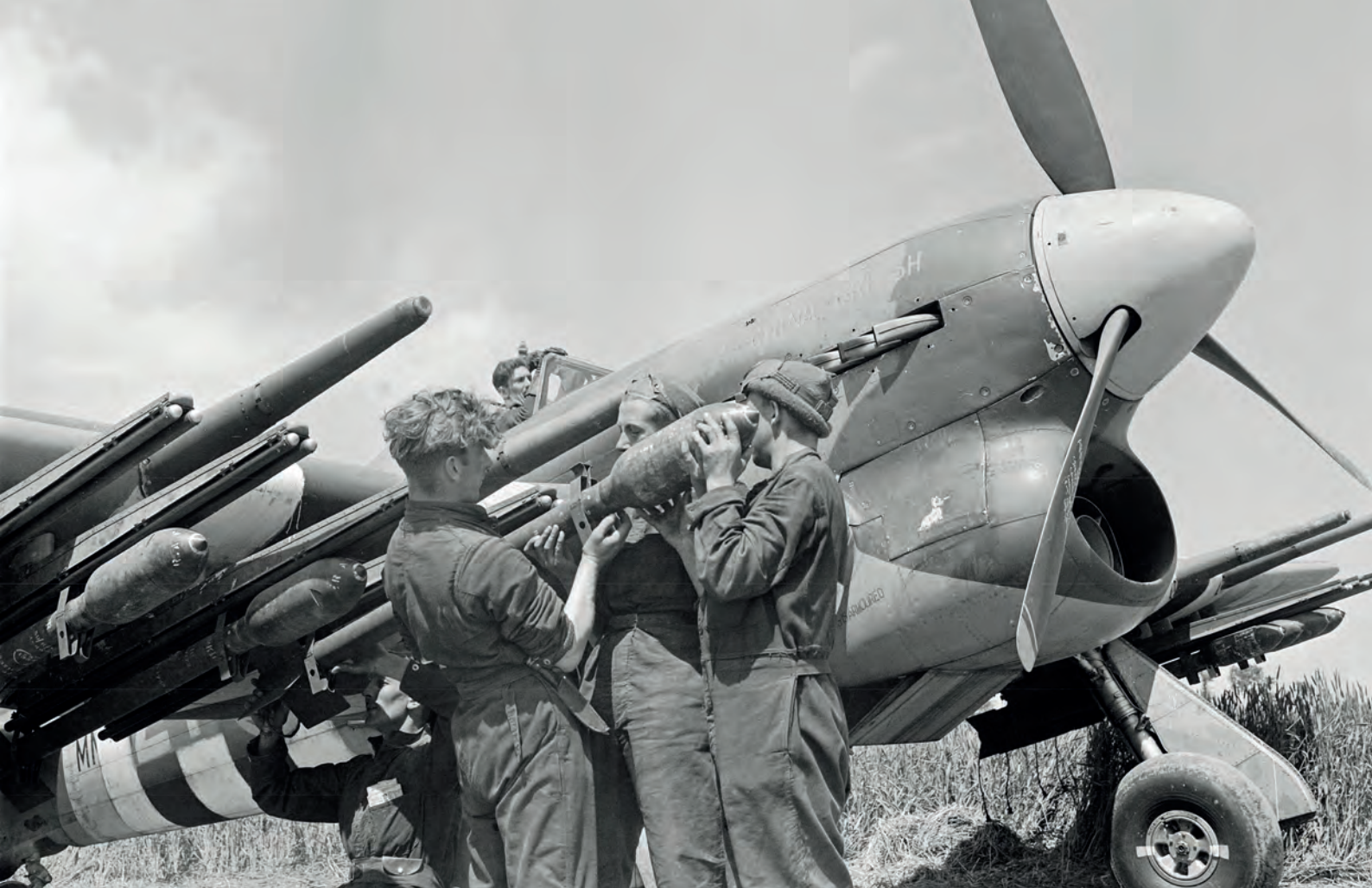
The armament technicians had their hands full when loading the Typhoon for a "rhubarb" mission.

snel getemperd: hij werd gedegradeerd en overgeplaatst wegens het niet opvolgen van bevelen. Jean de Selys-Longchamps zal niettemin een DFC ontvangen voor deze dappere daad. Hij verloor zijn leven op 16 augustus 1943 bij een Typhoon-crash bij terugkeer van een missie.