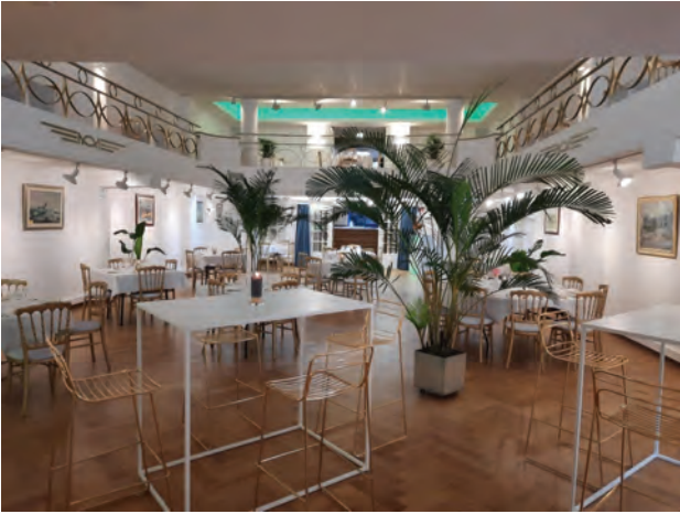
La salle Leboutte vue à partir du fond De Leboutte-zaal van achteren gezien