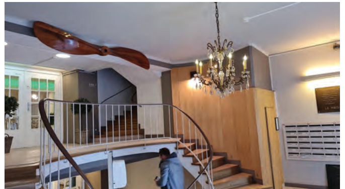
Le hall d'entrée new look De ingangshall new look