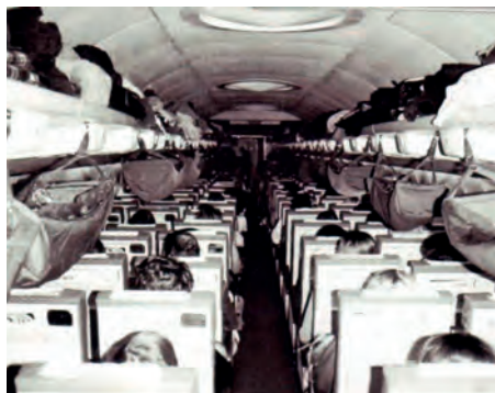
Hangmatten in de vliegtuigen, assistentie bij de aankomst...