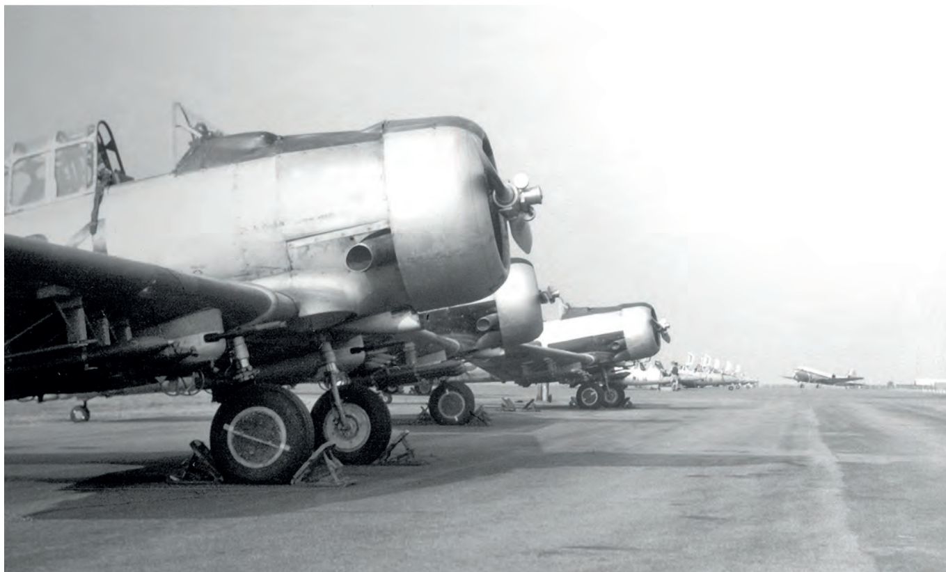
De Harvards in Ndjili. Op de achtergrond, de Fougas's.