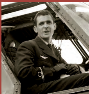
" Pussy "