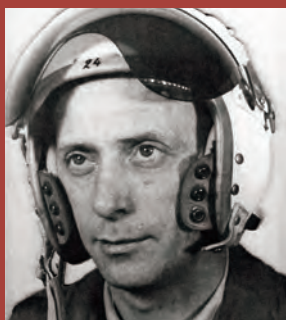
" Staf "