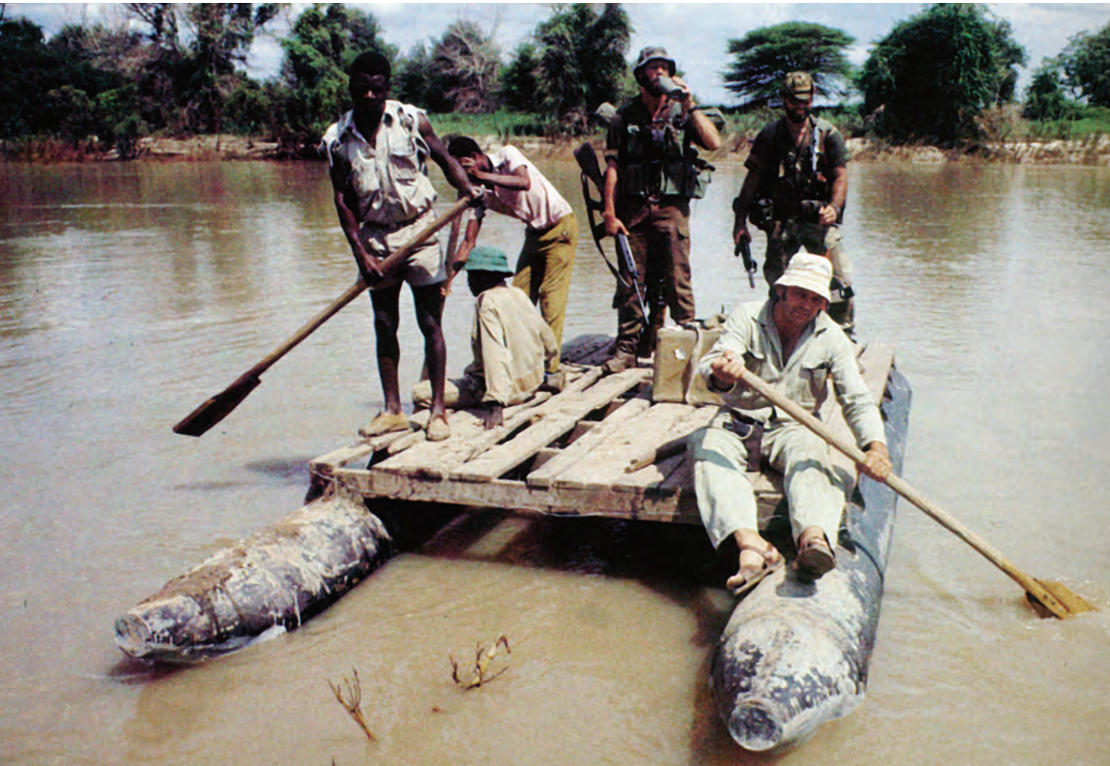
The H-21 ventral tank was used for different purposes